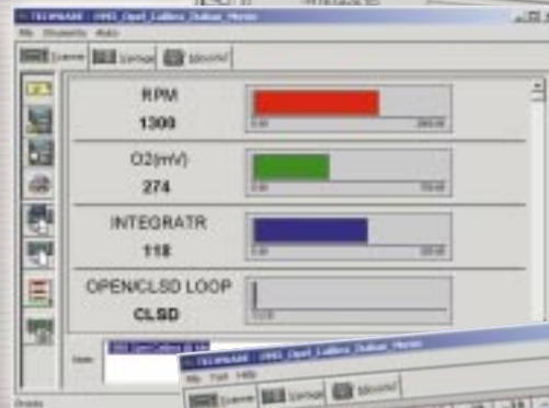
Oder als Balkendiagramm