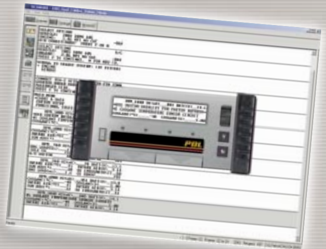
TECHWARE™ bietet unterschiedliche Darstellungsmöglichkeiten